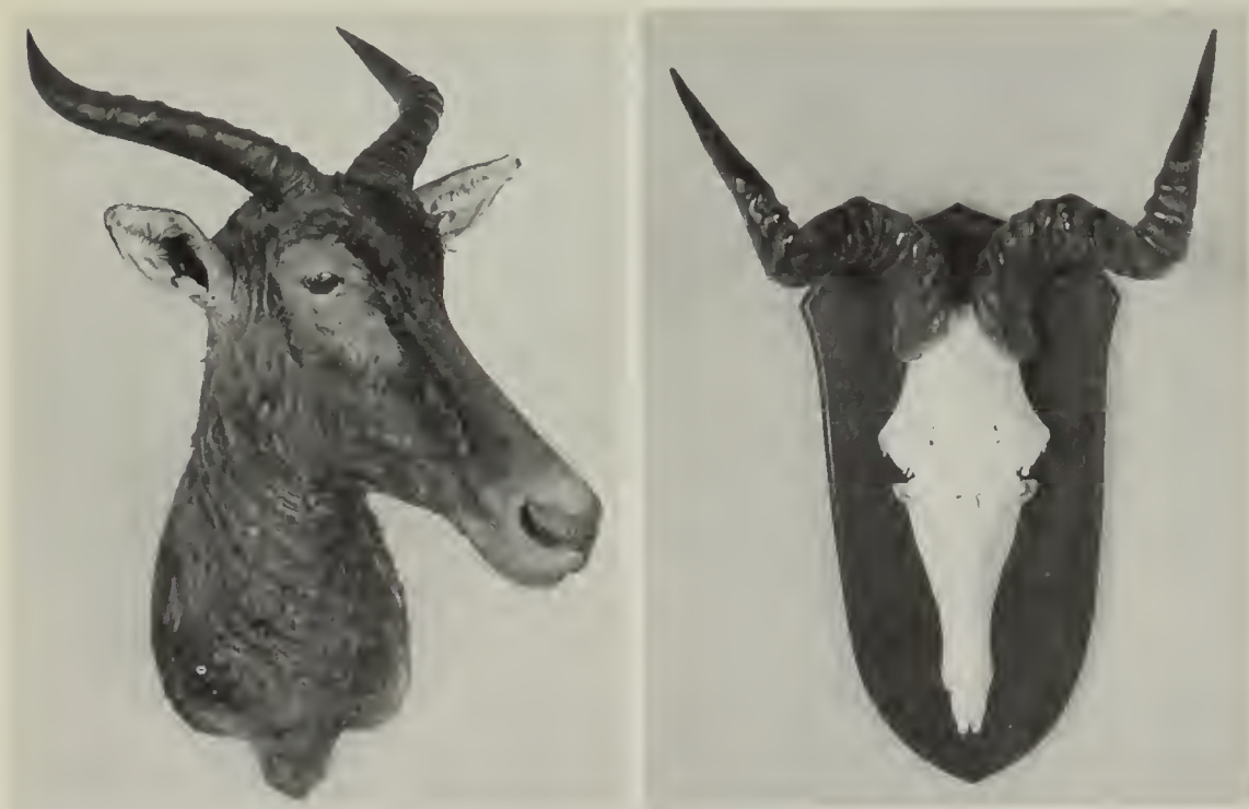
A sinistra: Damalisco ( Damaliscus lunatus lunatus Burchell, 1823); a destra: Alcelafo ( Alcelaphus buselaphus Pallas, 1766) del Kenia con caratteri di transizione tra la ssp. cokei Günther, 1884 e la ssp. lichtensteni Peters, 1949.

Damaliscus dorcas Pallas, 1766 - 2 teste di maschi adulti. D. d. dorcas Pallas, 1766 - Bontebok: una testa proveniente dal Sud Africa. D. d. phillipsi Harper, 1939 - Blesbok: una testa proveniente dal Sud Africa.